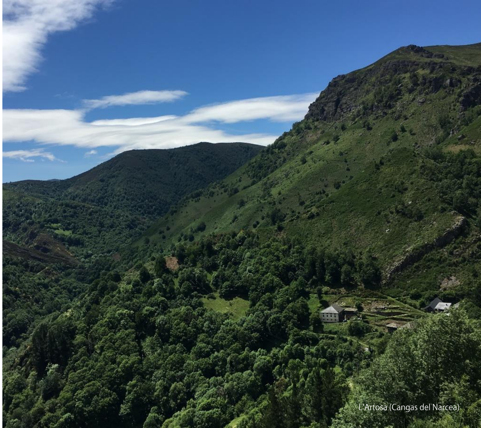
L'Artosa (Cangas del Narcea)

Fuerte vinculación socioeconómica fundamentada en la ganadería (extensiva), en los servicios (localizados en los núcleos urbanos, preferentemente en la villa de Cangas del Narcea) y en una ya reestructurada actividad minera.