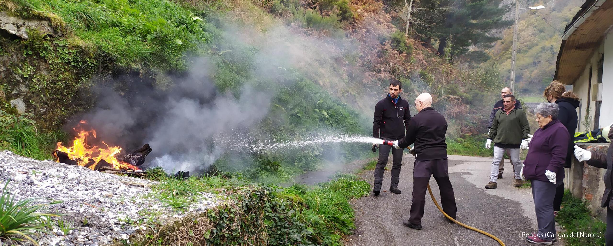
Rengos (Cangas del Narcea)

Proyecto promovido por la Asociación Centro de Desarrollo Alto Narcea Muniellos en colaboración con SEPA Tebongo, concretamente con el Parque de Bomberos de Cangas del Narcea e Ibias .