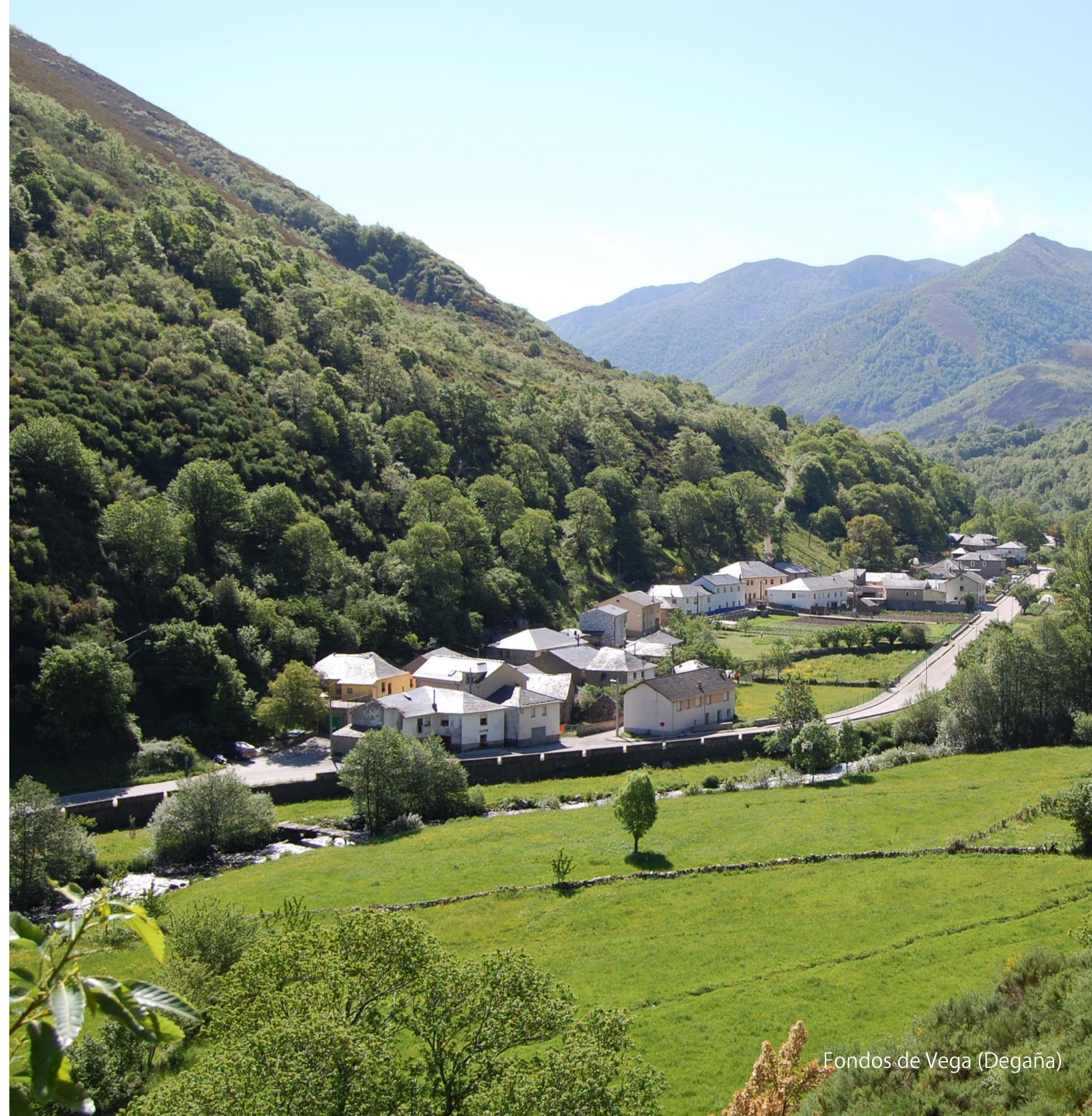
Fondos de Vega (Degaña)